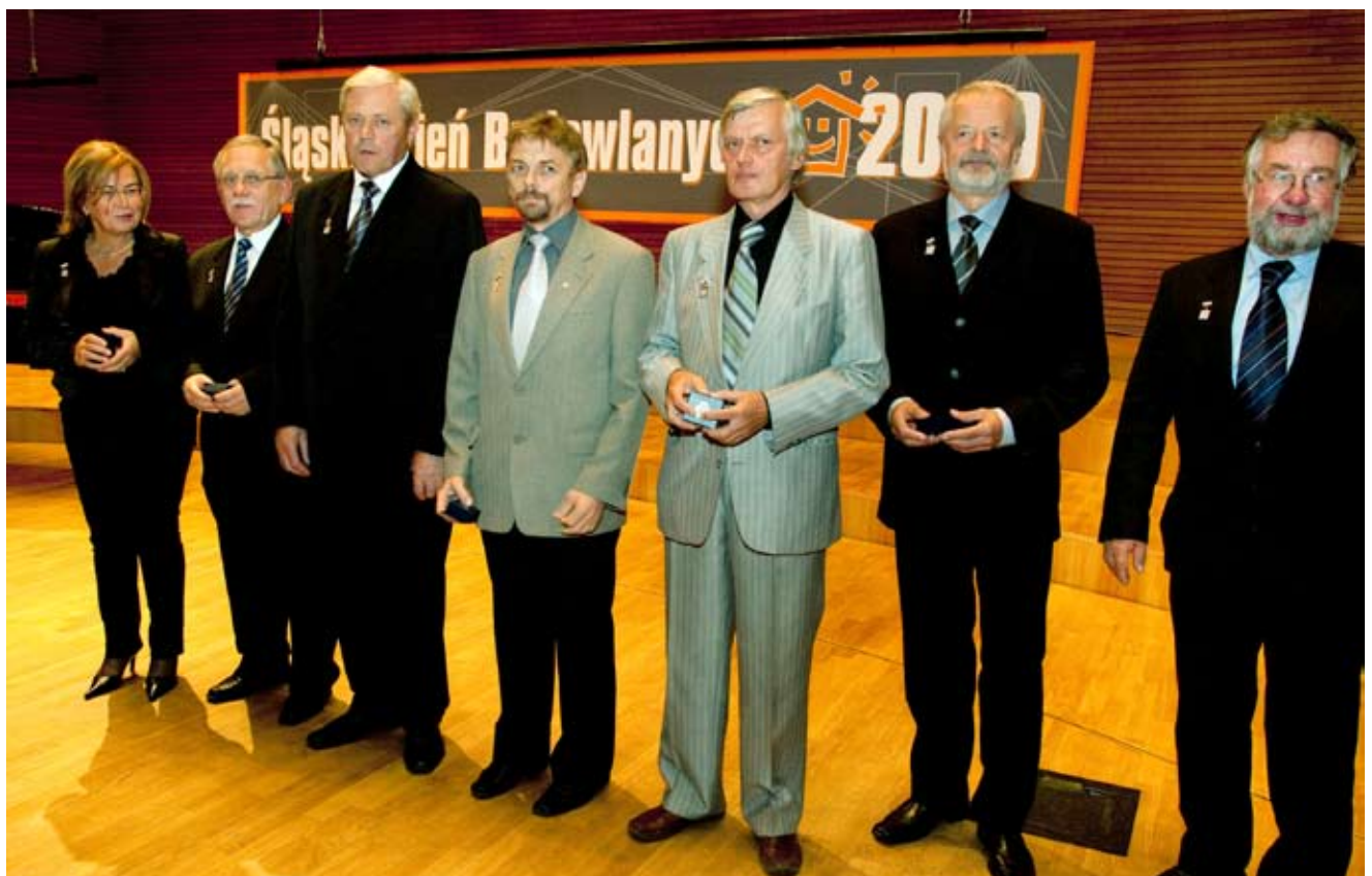
Laureaci Złotych i Srebrnych Honorowych Odznak PIIB